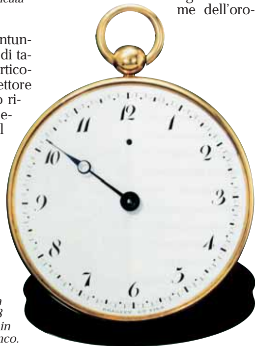
Il primo orologio da tasca Souscription, il No. 1278 monolancetta con quadrante in smalto bianco.

una ventina saranno forniti quindi alla Marina Francese. In quell'anno Breguet moriva, e immediatamente tutti riconobbero in lui l'uomo che aveva rivoluzionato, con la sua genialità, ogni settore dell'orologeria.