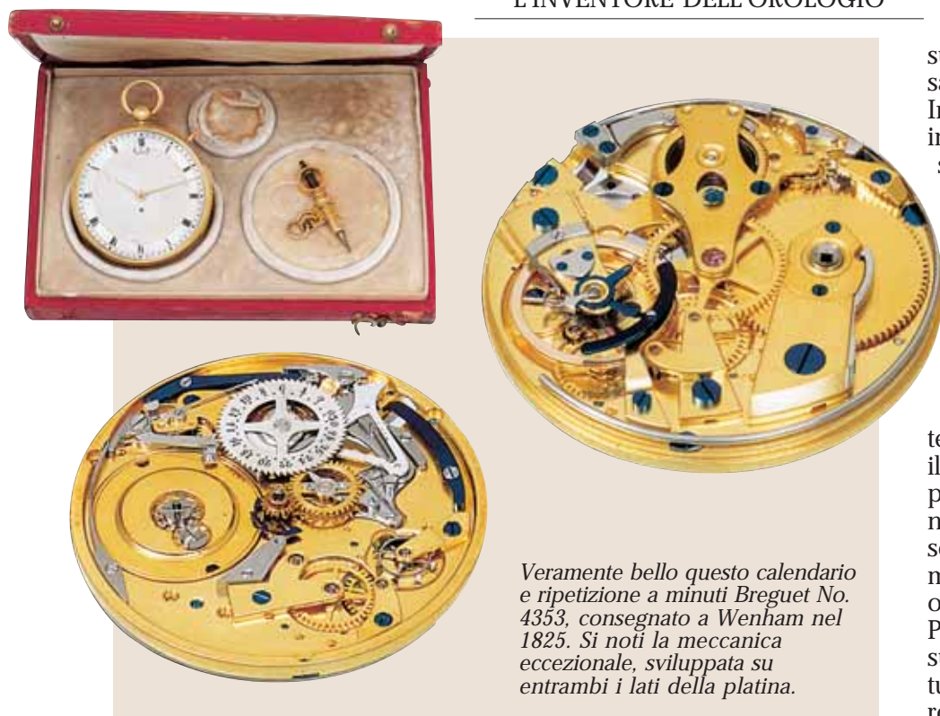
Veramente bello questo calendario e ripetizione a minuti Breguet No. 4353, consegnato a Wenham nel 1825. Si noti la meccanica eccezionale, sviluppata su entrambi i lati della platina.