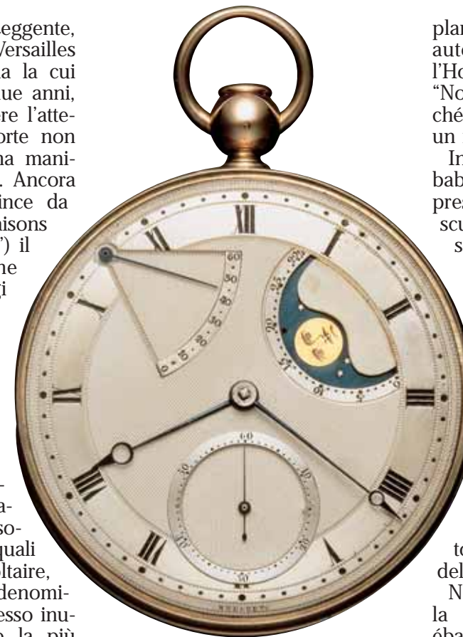
La "Montre Perpetuelle" No. 5, la cui costruzione, iniziata nel 1778, terminò solamente nel 1792. Si tratta di uno dei primissimi orologi a carica automatica, sfruttando un concetto, quello del "pendolo a gravità", che diverrà poi la norma su tutti i modelli automatici odierni.

In tale periodo di transizione si colloca l'attività di Abraham-Louis Breguet, iniziata in Quai d'Horloge a Parigi nel 1775, dopo un oscuro periodo che intercorre tra la fine del suo apprendistato e le nozze con una giova-