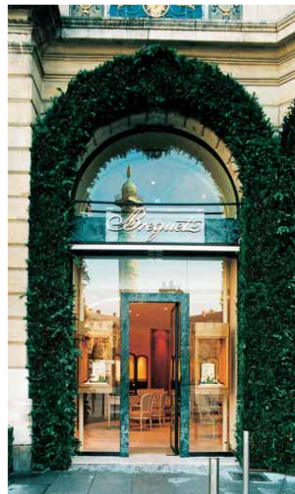
La Boutique Breguet di Place Vendôme 20, naturalmente a Parigi.

monianze di un patrimonio straordinario, questi orologi dimostrano che in 225 anni di storia la Casa ha saputo conservare i suoi valori fondamentali e la