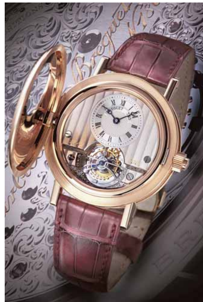
Il nuovo modello Classique Tourbillon anniversario, realizzato in serie numerata di 200 esemplari.

L'odierno Type XX riprende tutte le caratteristiche fondamentali del modello originale, tra cui la famosa funzione "retour en vol", ideata espressamente per l'aeronautica. Tre le varianti oggi in produzione: il modello base, Aeronavale, con cassa in acciaio e quadrante a tre contatori nero; l'evoluzione Transatlantique, con in più il datario al sei, proposta anche negli allestimenti in oro giallo, bianco o rosa; il Ladies' Type XX, in acciaio, nella misura più piccola adatta al polso femminile.