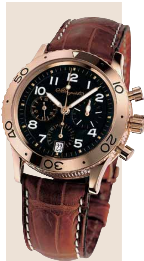
Il Type XX Transatlantique, modello da aviatore con funzione flyback per il contemporaneo azzeramento e avvio della funzione cronografica.

sito merita un ricordo particolare la figura di Louis Breguet (1880-1955), che dopo le importantissime innovazioni introdotte dai suoi antenati nell'orologeria prima, e poi nelle scienze fisiche e nelle telecomunicazioni, si lanciò alla conquista dell'aria. Nel 1907 realizzò il giroplano, precursore degli elicotteri moderni. Nel 1909 nacquero i primi biplani, nel 1912 fu la volta degli idrovolanti e nel 1915 dei primi bombardieri, sempre naturalmente Breguet. Nel 1917 l'entrata in servizio del Breguet 14 diede un contributo notevolissimo alla vittoria degli alleati. Dal canto suo, la fabbrica di orologi Breguet s'interessò ben presto al nuovo mercato rappresentato