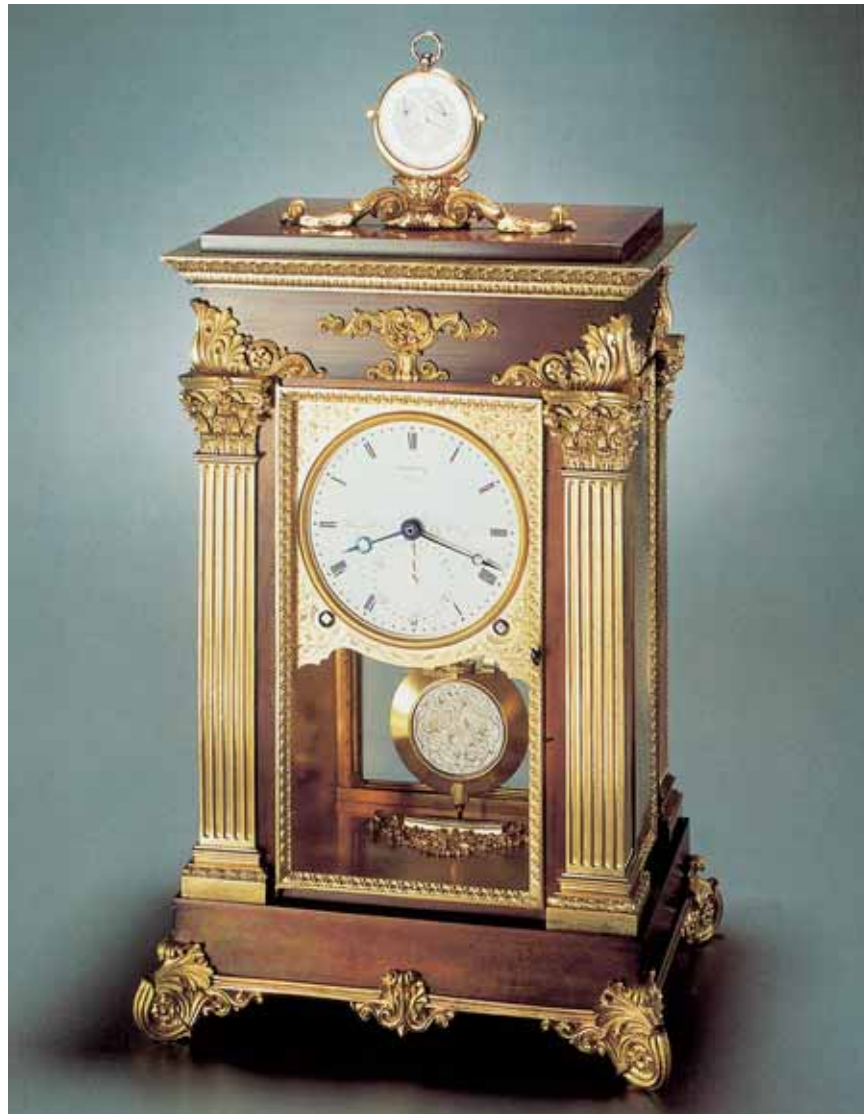
La Pendulette Sympathique No. 257, stupendo esempio di funzione applicata all'estetica.

gnosi, di classe, che gli consentiranno di acquisire e mantenere quel prestigio che lo porrà ai vertici o, come si ama dire oggi, nel gotha dell'alta orologeria.