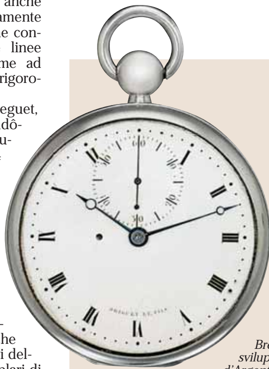
Breguet No. 3595, modello da tasca sviluppato sul principio del "Garde Temps d'Argent", databile 1821.

La prima Boutique Breguet, situata al 20 di Place Vendôme a Parigi, è stata inaugurata ufficialmente il 14 settembre 2000, ed è l'emblema dei rapporti secolari che, dal lontano 1775, legano la Maison alla capitale francese (nel corso del 2001 apriranno inoltre altre due boutique, a Cannes e a Londra). Nel corso di quella cerimonia è stato inaugurato anche il Museo Breguet, che custodisce i celebri archivi della società e oltre 40 esemplari di orologi antichi. Autentiche testi-