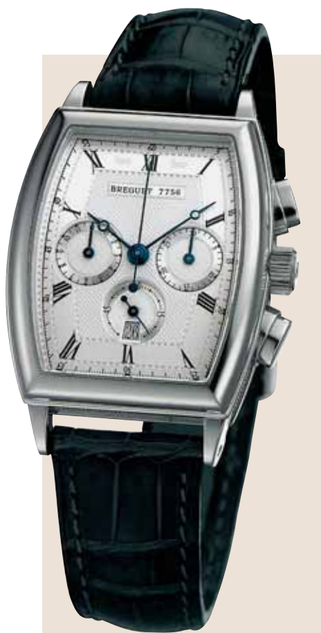
Il Breguet Heritage nella versione cronografo, con movimento meccanico e datario.

Casa. In catalogo ne troviamo però solamente la versione più prestigiosa: con cassa in oro e movimento sdoppiante.