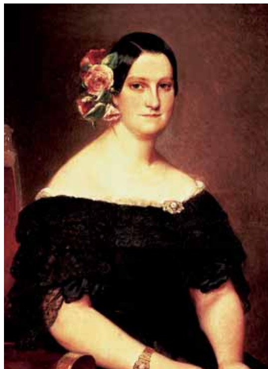
Tra gli estimatori di Breguet, la Regina di Spagna, Maria Cristina di Borbone-Sicilia.

passivamente ai tumultuosi avvenimenti del suo tempo. Membro del "Club dei Giacobini", associazione politica dal carattere inizialmente moderato, operante nel periodo della Rivoluzione, aperta a chiunque volesse farne parte, previo pagamento, dal 1790 sarà membro della Nuova Assemblea Municipale di Parigi. Se tanto di lui si è scritto in qualità di orologiaio, pressoché sconosciuto risulta essere il suo nome nelle cronache della Rivoluzione e nebulose ed ipotetiche le motivazioni che nel cruciale anno 1793 l'avrebbero indotto a rifugiarsi in Svizzera con il pretesto