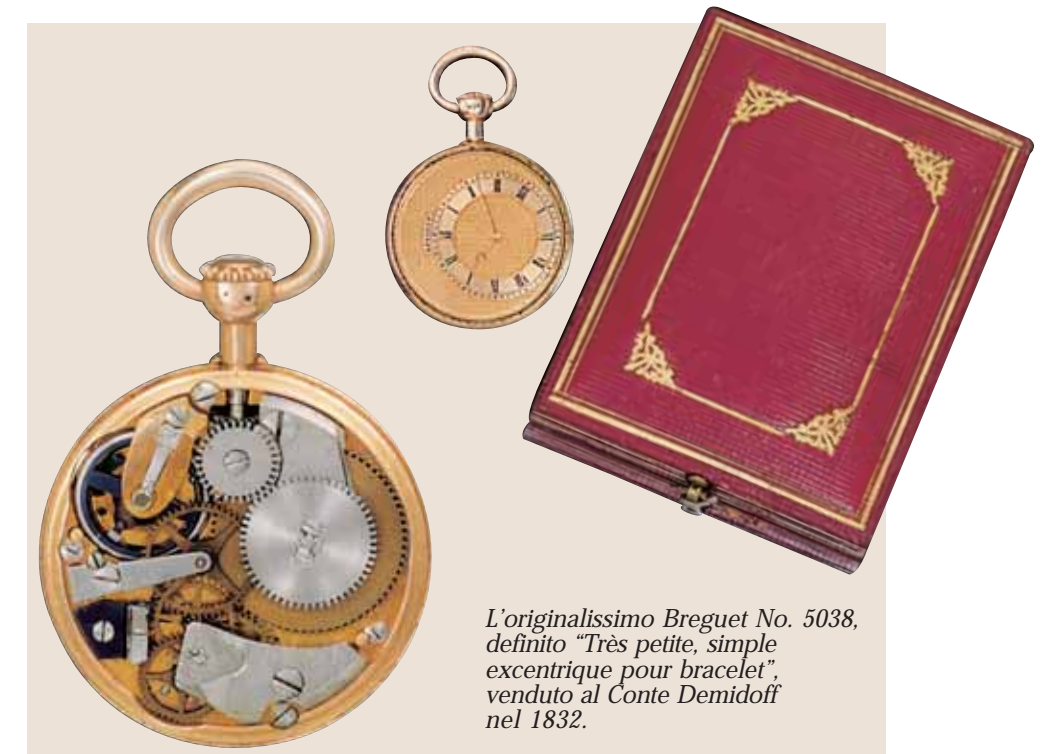
L'originalissimo Breguet No. 5038, definito "Très petite, simple excentrique pour bracelet", venduto al Conte Demidoff nel 1832.

Il desiderio di Hayek è di continuare su questa strada, fondendo insieme tradizione, spirito innovativo e gusto della modernità, coltivando il prestigio e la classe che fanno di Breguet uno dei più interessanti rappresentanti dell'arte e della cultura tecnica europea. Naturalmente per raggiungere questi obiettivi sono stati compiuti investimenti rilevanti nel settore della produzione, allo scopo di ingrandire la Manifattura e di rispondere sempre meglio alle esigenze della clientela. Parallelamente Hayek ha iniziato l'ottimizzazione delle risorse presenti nell'orologeria, partendo dal rafforzamento delle Scuole di Alta Orologeria esistenti, con l'intento futuro però di aprirne una nuova, che avrà il compito di tramandare le conoscenze artigianali accumulate nei secoli dai grandi maestri orologiai.