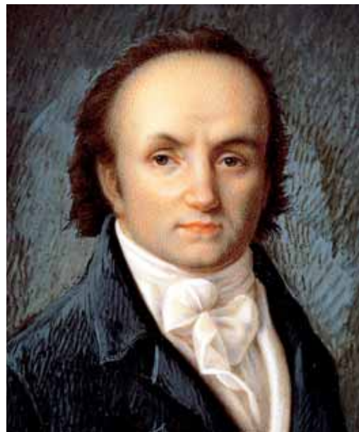
Un ritratto di Abraham-Louis Breguet.

A braham-Louis Breguet, il genio dell'orologeria, il commerciante, l'imprenditore dai ben noti risultati, svolse la sua inimitabile opera in un momento storico complesso, agitato da grandi sconvolgimenti sociali ed economici. Un periodo spazzato dal vento illuminista, soffiato da una rivoluzione che nel breve spazio di un lustro avrebbe posto in discussione tutte le fatiscanti regole dell'umano consorzio, andando fortunatamente ben oltre i limiti geografici della Francia stessa. Anche l'arcaico e monocorde mondo dell'orologeria, regolato da vecchi statuti e sempre più privo della solida figura del "maestro" in grado di realizzare da solo il suo segnatempo, afflitto dall'aumento esponenziale delle richieste e dall'impossibilità di incrementare la produzio-