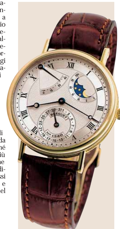
Uno dei modelli più semplici e tradizionali della produzione odierna, il Classique Mod. 3130.

«Breguet fabbrica orologi che non si guastano per vent'anni, mentre la miserabile macchina che ci fa vivere si guasta e produce il dolore almeno una volta