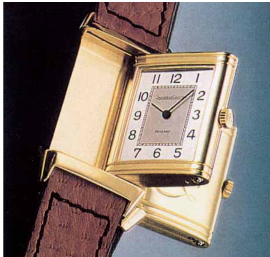
Tra il 1975 e il 1985 furono prodotti dei Reverso con delle modifiche rispetto alla versione originale, senza nervature sul supporto e con un solco in meno sulla parte alta e bassa della lunetta. Questo modello è del 1979 e impiega un calibro manuale Jaeger-LeCoultre 846.

Chi oggi sogna o possiede un Reverso non basa certo la sua passione su questi argomenti: se si parla di robustezza, negli ulti-